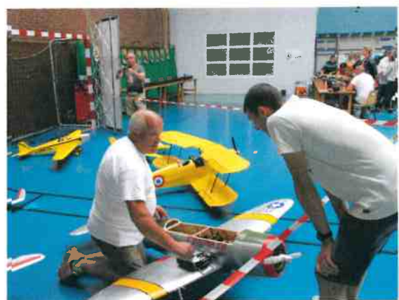
Dans le gymnase, aéromodélisme et tir sportif voisinent tous les ans