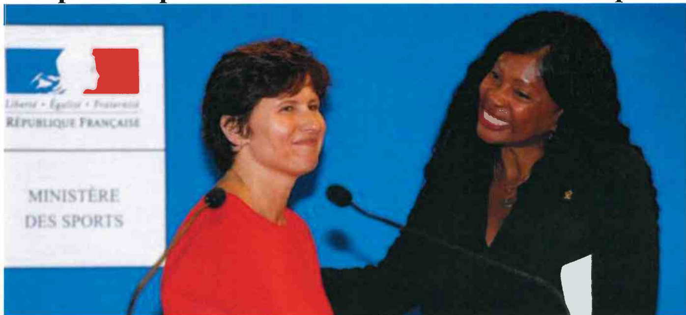
Passation de pouvoir entre Laura Flessel (à droite) et Roxana Maracineanu (à gauche), nouvelle ministre des sports.

La rentrée a peine passée, Laura Flessel, ministre des sports a démissionné pour « raisons personnelles ». Roxana Maracineanu a donc été nommée à sa place le mardi 4 septembre .