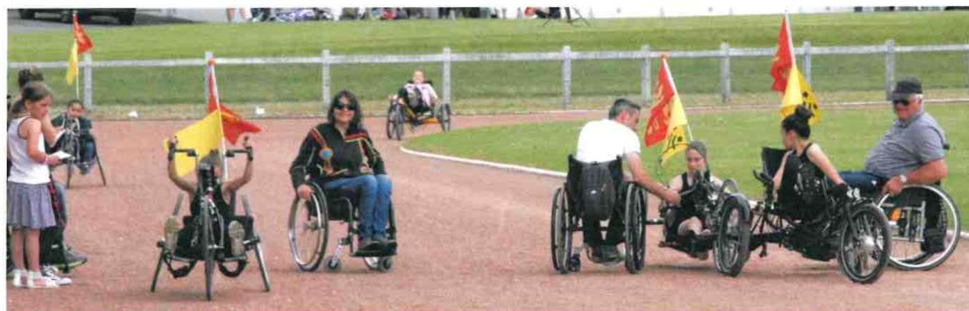
L'association « Sport handi nature » a proposé des initiations pendant tout le week-end