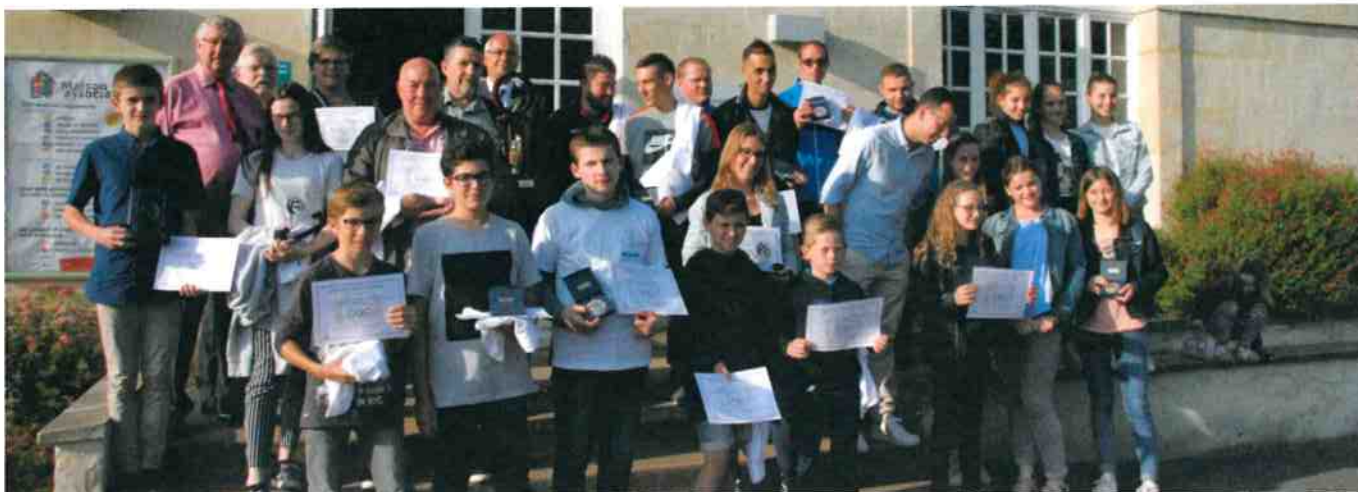
Tous les lauréats de l'édition 2018 réunis à l'issue de la soirée du Fair-Play