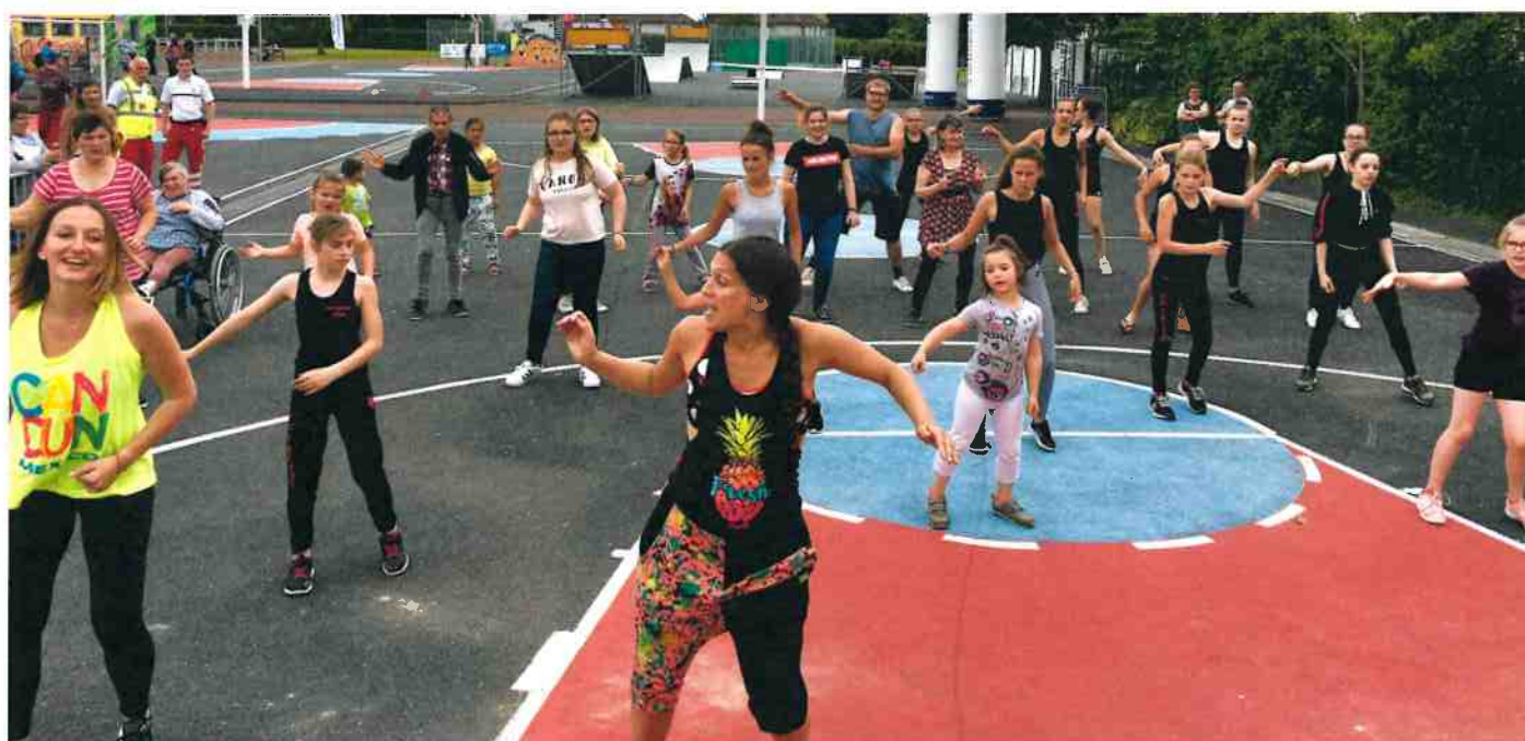
Retour en force de la Zumba pour l'édition 2018 de la Fête du sport à Colombelles