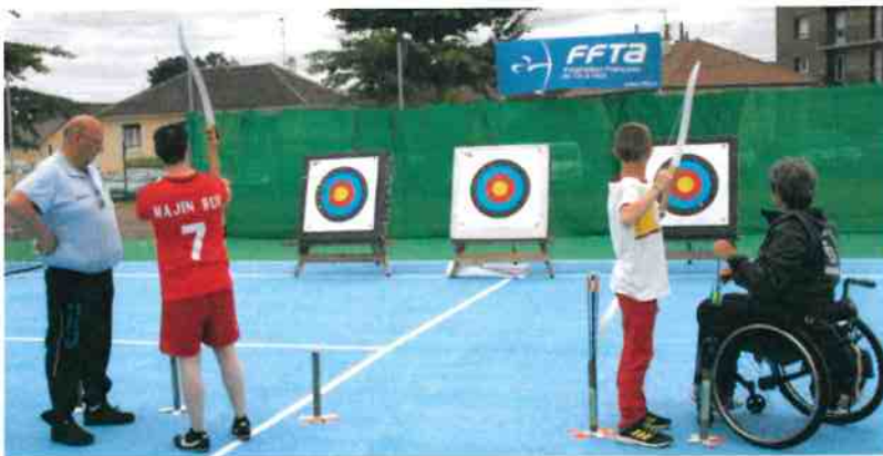
Le comité de tir à l'arc avait pris ses quartiers sur les courts de tennis