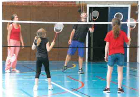
Nouveauté 2018, l'initiation en famille au badminton