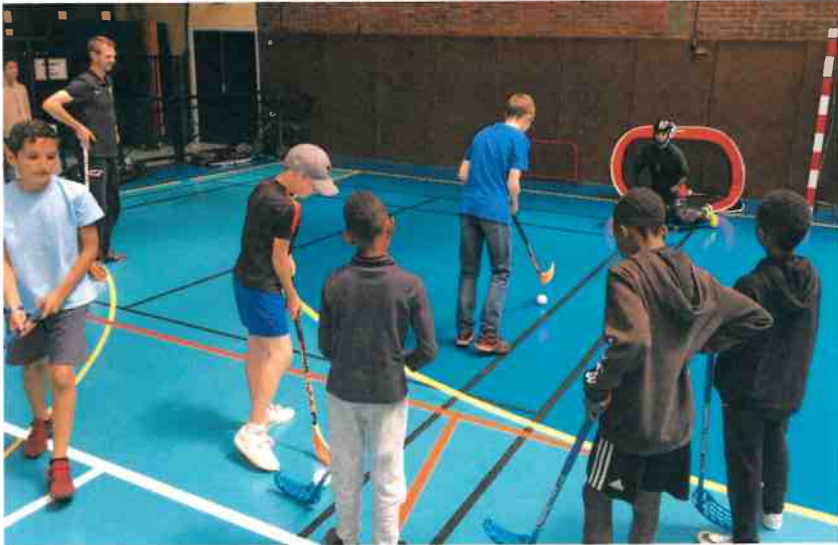
Floorball: une initiation au « Hockey en salle ».