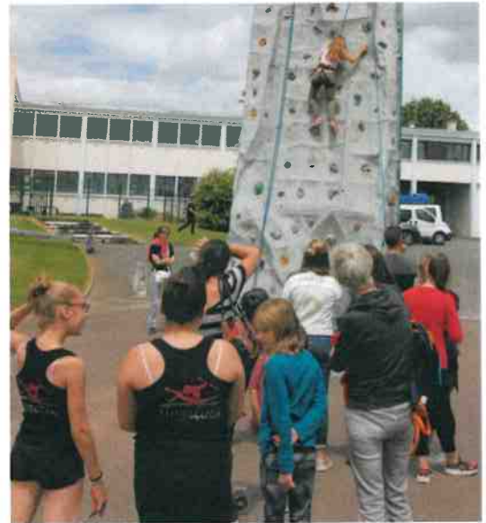
Grande tradition, le mur d'escalade n'a pas désempi