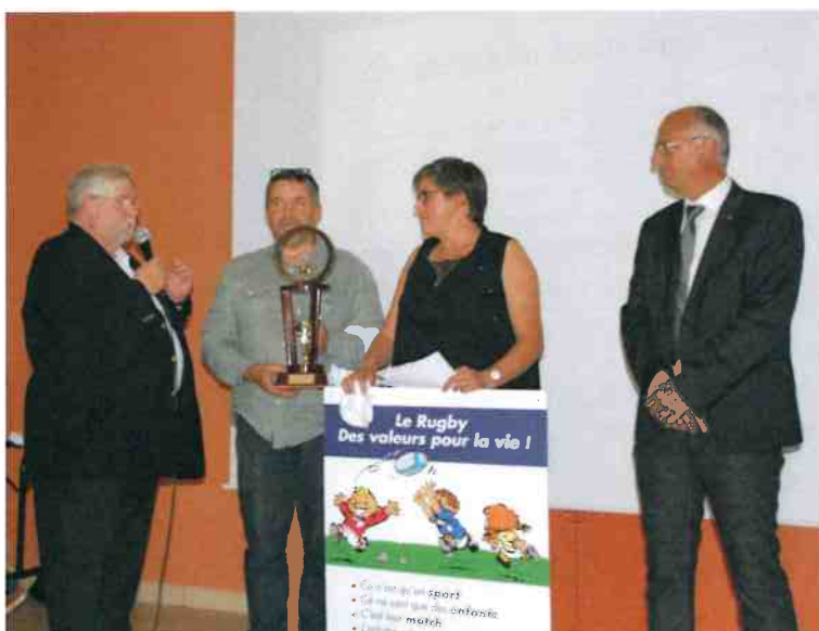
La récompense suprême est revenue cette année au comité de Rugby