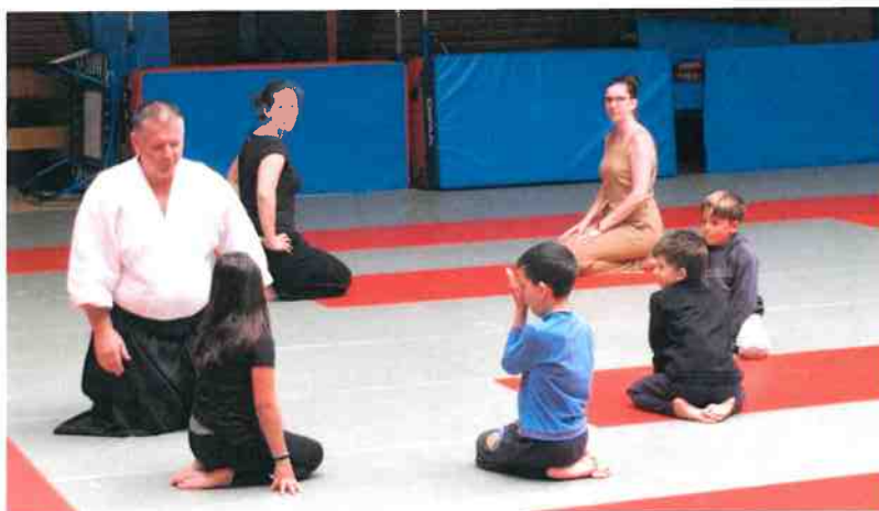
Parmi les nombreux sports de combat, l'Aïkido