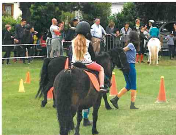
L'équitation toujours présente à notre fête

L'occasion pour les quelques 1500 visiteurs sur le week-end de pratiquer les 34 disciplines sportives proposées pour l'occasion. Une offre très variée qui a notamment permis aux jeunes participants du fil rouge de multiplier les essais de nouveaux sports.